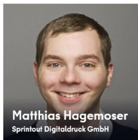
Matthias Hagemoser Sprintout Digitaldruck GmbH