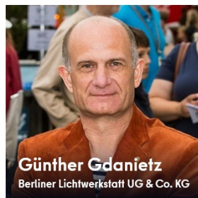
Günther Gdanietz Berliner Lichtwerkstatt UG & Co. KG